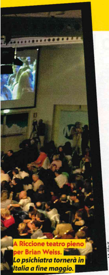
A Riccione teatro pieno per Brian Weiss. Lo psichiatra tornerà in Italia a fine maggio.